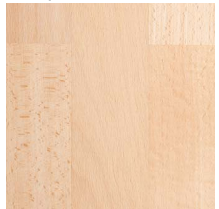
3-Stab Schiffsboden 524074 Buche ged. natura SaphierMatt

Südbrock Holzfußleisten: 22.40.2 Buche furniert, 20 x 40 mm, 250 cm 22.60.2 Buche furniert, 20 x 60 mm, 250 cm