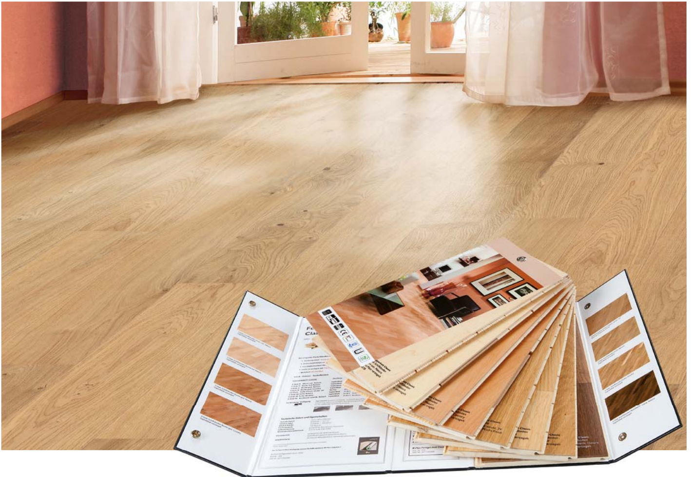
3-Stab Schiffsboden 524078 Can. Ahorn natura SaphierMatt