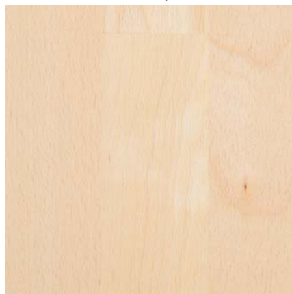
3-Stab Schiffsboden 524077 Buche hell natura SaphierMatt

Südbrock Holzfußleisten: 22.40.14 Buche hell, 20 x 40 mm, 250 cm 22.60.14 Buche hell, 20 x 60 mm, 250 cm